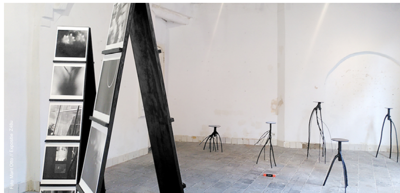
Expositie '24bu

Wij dragen zorg voor de doelstelling van Het Langhuis om experimentele beeldende kunst te tonen en een springplank te zijn voor beginnende kunstenaars. Het bestuur zorgt ervoor dat de artistieke kwaliteit, integriteit en onafhankelijkheid worden gewaarborgd. Het bestuur doet dit zowel intern als in de verhouding met subsidiënten, sponsors, private en overige financiers. Stichting het Langhuis is een ANBI stichting, de organisatie is transparant en controleerbaar aan de hand van publieke jaarverslagen. De stichting ontvangt (mede) financiering van private partijen/individuen. Dit heeft geen invloed op de uitvoering; de maatschappelijke doelstelling van de organisatie blijft centraal staan. Onder de ANBI voorwaarden kent het bestuur geen beloningen, dit draagt mede bij aan dat bestuurders het belang van de organisatie prevaleren boven hun eigen belangen. Mede daarom is een Raad van Toezicht in ons geval niet nodig. De bestuurders zorgen voor een cultuur van openheid en aanspreekbaarheid. Wij hebben jaarlijks 9 inspraakmomenten voor vrijwilligers en andere betrokkenen met het bestuur en de operationeel manager. Hierin wordt aandacht besteed aan de vragen, zorgen en initiatieven van alle betrokkenen.