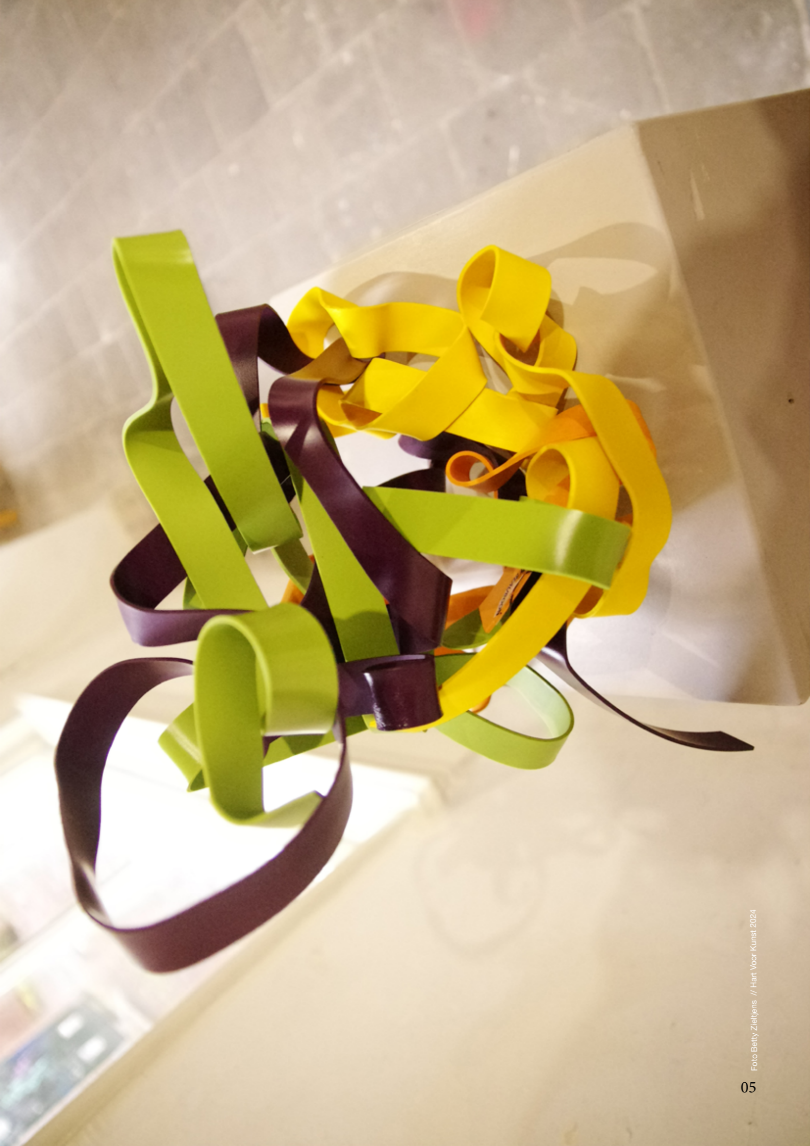
Hart Voor Kunst 2024